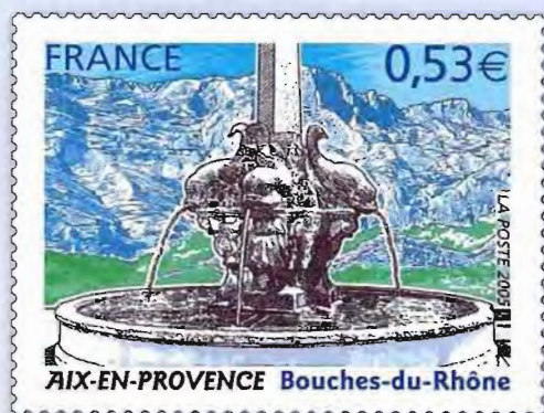
Photo d'après maquette et couleurs non contractuelles